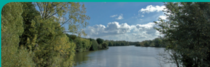
◉ Le Frémur