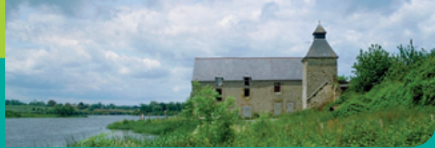
◉ Manoir de Pomphily