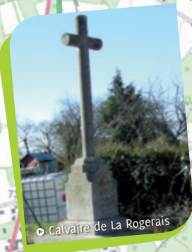
Calvaire de La Rogerais

Extrait de carte IGN