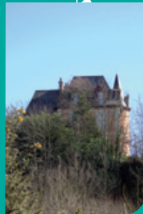
◉ Château de Kergoat