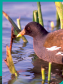
◉ Poule d'eau